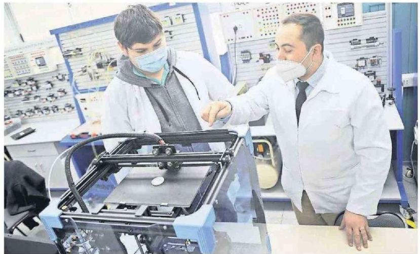
LAS ALZAS REGISTRADAS EN LAS MATRÍCULAS REVELAN UNA MAYOR VALORIZACIÓN DE LAS ENTIDADES EDUCATIVAS TÉCNICAS EN LOS ÚLTIMOS AÑOS.

Parte importante del incremento de matrículas en los IP se presentó en los programas "A distancia", con un 8,8%, en comparación a 2023.