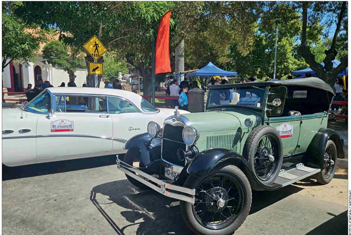
El Ford A de 1928, propiedad de Carlos Verdugo.

En el resto del país también será posible ver desfiles de hermosos modelos antiguos, pertenecientes a