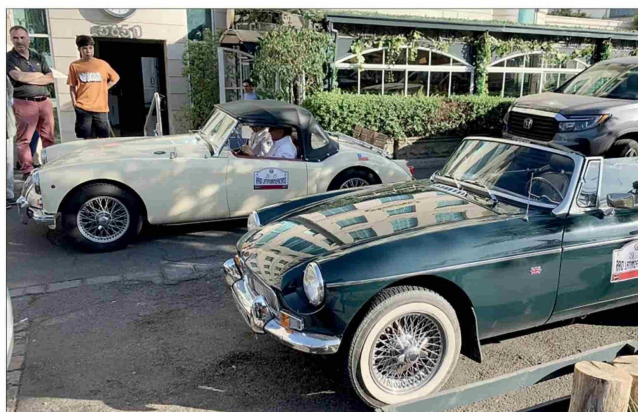
Un MG A de 1962 y un MG B de 1978.