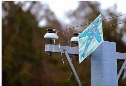
EL LLAMADO ES A ENCUMBRAR LEJOS DE POSTES Y AUTOPISTAS.

"Ha habido casos de gente que ha perdido sus dedos, sus manos, porque pasan por ahí sin darse cuenta e incluso hay gente que ha fallecido: para la gente que anda en motoci-