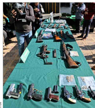
Incautaciones de armas de grueso calibre, y también arrestos, fueron ajustados a derecho, afirmaron en Carabineros y la fiscalía.