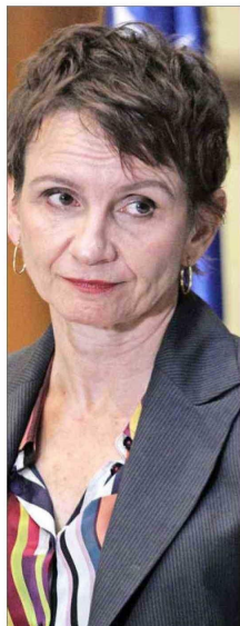
Carolina Tohá (PPD), ministra del Interior.