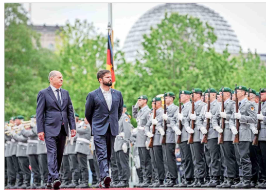
El Canciller alemán, Olaf Scholz , no pudo ocultar su desazón por los magros resultados electorales que obtuvo el fin de semana su partido, durante las actividades oficiales que compartió con el mandatario chileno. En la imagen, ambos pasaron revista a la guardia de honor en Berlín. | C 1

Bolsas europeas y moneda única registran una baja moderada tras triunfo de la derecha en el Parlamento Europeo | B 5