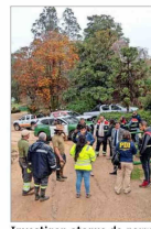
Investigan ataque de perros asilvestrados en Zoológico de Quilpué que causa la muerte de 23 ciervos y dos pavos reales. | C 8

COLUMNA CONJUNTA DE LOS JEFES DE ESTADO: "UN CLUB DEL CLIMA PARA IMPULSAR UN CRECIMIENTO INDUSTRIAL RESPETUOSO CON EL CLIMA" | A 2 EDITORIAL: "SEÑALES EUROPEAS" | A 3