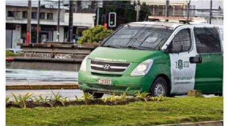
LA DELINCUENCIA ES EL MAYOR TEMOR DE LA REGIÓN.

zan las municipalidades, solo el 13% de las personas le coloca un 6 o 7 a la labor que efectúan. Vallespín señala que le llama la atención este descontento, puesto que los municipios son en los sectores más alejados la entidad más cercana que tiene la comunidad, entonces “que exista este descontento creo que se debe tomar nota de esa preocupación”.