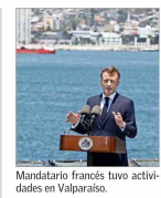
Mandatario francés tuvo actividades en Valparaíso.

Presidente Macron recibe carta de congresistas UDI por refugio en Francia de exfrentista condenado por el crimen del senador Guzmán | C 3