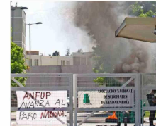
Personal penitenciario protesta en la entrada del establecimiento de la Región de O'Higgins.

Recriminaciones cruzadas agudizan la crisis oficialista. Jefe de bancada del FA remarca que el acusado no es de sus filas, luego de que extimoneo del PS reprochara el "amateurismo" para afrontar el problema.