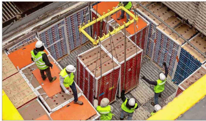
En los últimos 20 años, los envíos de frutas frescas han registrado un aumento de 292%, según estima Prochile.