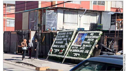
"Sangre por sangre" se podía leer ayer en una de las coronas dejadas en lo que sería el velorio de "El Nano", identificado como traficante en el lugar.

Durante la tarde de ayer fue hallado un vehículo que habría