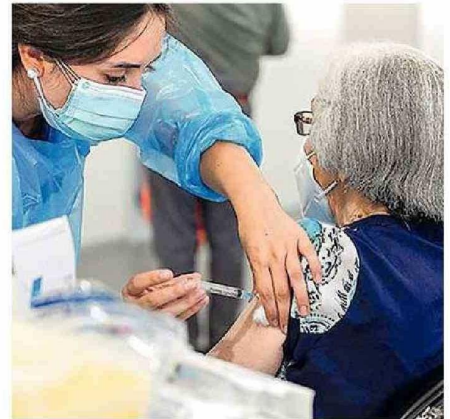
LA AUTORIDAD SANITARIA LLAMÓ A ADULTOS MAYORES A VACUNARSE.