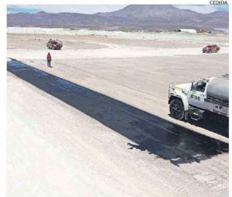
TRABAJOS PARA HABILITAR LA POSADA DE HELICÓPTERO EN OLLAGÜE.