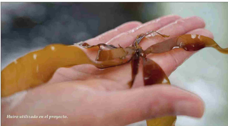
Huiro utilizado en el proyecto.

El objetivo de Anglo American es que este proyecto piloto se pueda escalar y permita dar pie a desarrollos de créditos de Carbono Azul, mejorar la calidad de vida de las comunidades, restaurar ecosistemas altamente afectados por la sobreexplotación y contribuir a la meta de carbono neutralidad del país hacia 2050.