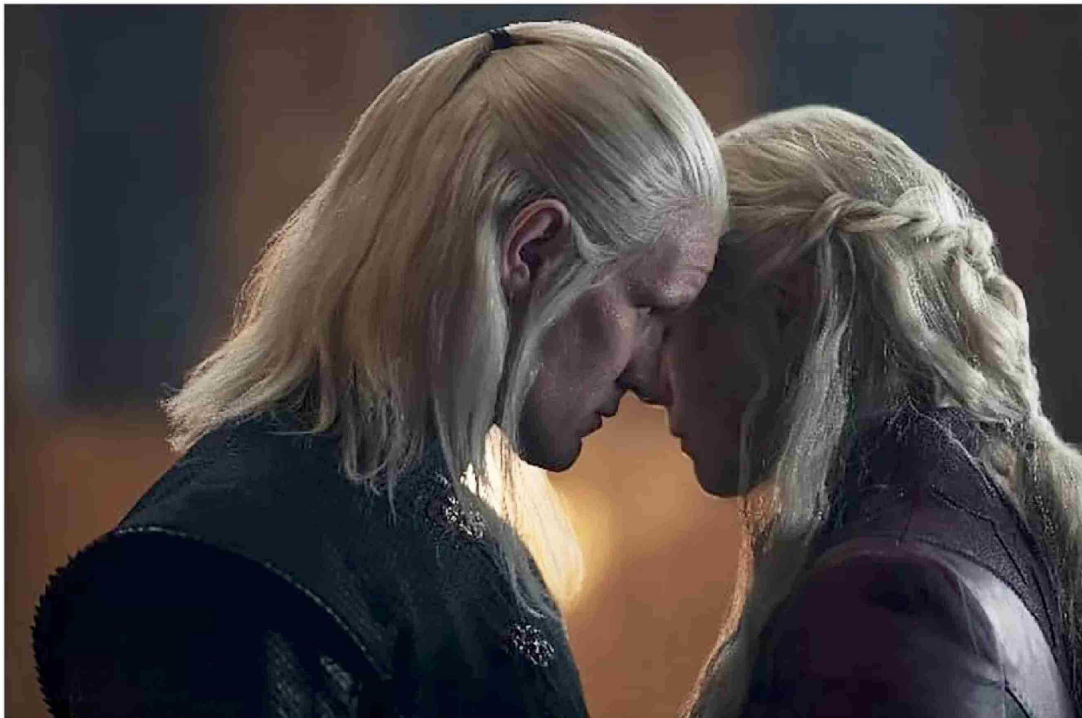
CAPTURA DE PANTALLA

Por qué el color: Es el tono de la casa Targaryen.