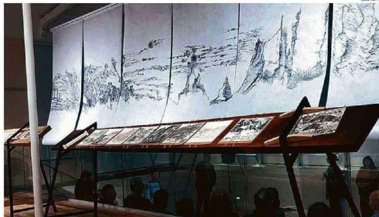
LA ARTISTA EXPLORA EN “EL VALLE DEL ARNO” LA TÉCNICA DE ACHURADO A MANO ALZADA.

La artista advierte que “no conozco el Valle del Arno, pero espero hacerlo pronto, para dibujarlo de nuevo, ahí en directo. Sin embargo, con todo este tiempo dibujándolo, es como haber estado ahí,