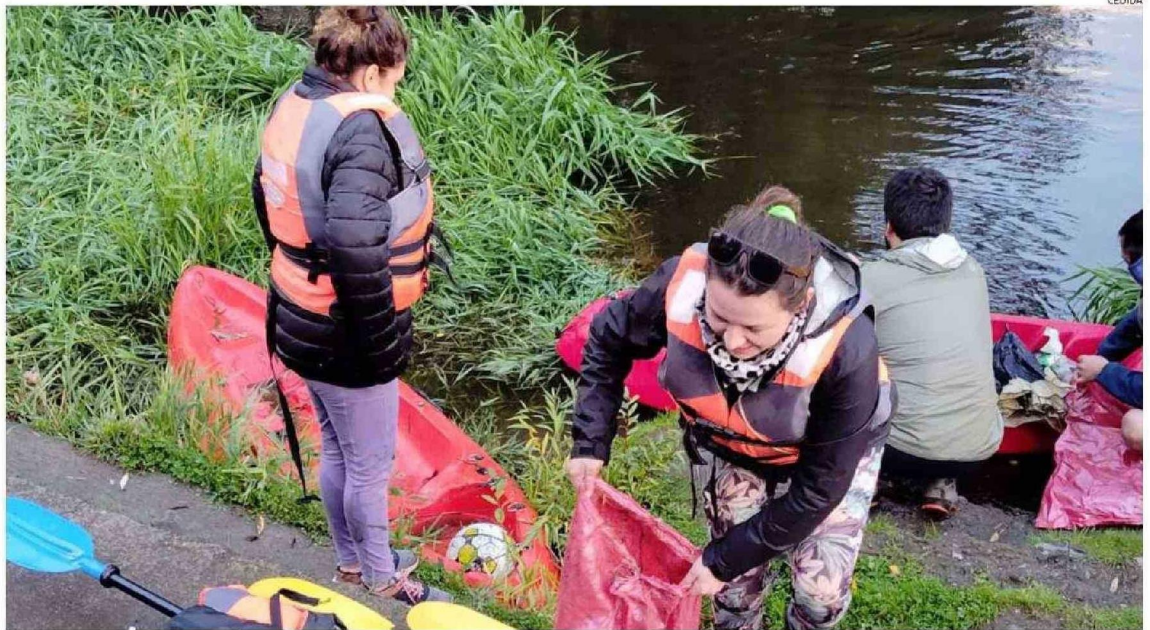
LA LIMPIEZA EN KAYAK ES UNA TRAVESÍA, QUE SE REALIZA DESDE EL PARQUE CHUYACA HASTA EL PARQUE CUARTO CENTENARIO, Y DONDE SE EXTRAEN LOS MÁS INSÓLITOS ELEMENTOS.

“La primera jornada de limpieza en embarcación, en canoa y en kayak, se desarrolló en conjunto con la Universidad San Sebastián y los establecimientos educativos Osorno College y el Colegio San Mateo,