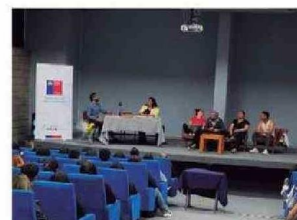
Personas presenciaron y fueron partícipes de la Obra de Teatro LOS MAZALEZ en UTA Arica.