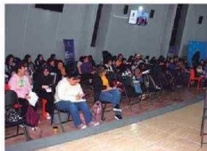
Personas presenciaron y fueron partícipes de la Obra de Teatro LOS MAZALEZ en Iquique.