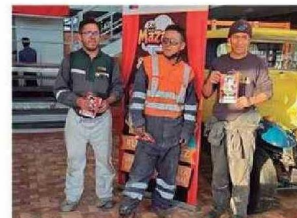
Personas presenciaron y fueron partícipes de la Obra de Teatro LOS MAZALEZ en Calama.