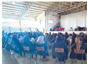
Personas presenciaron y fueron partícipes de la Obra de Teatro LOS MAZALEZ en La Serena.