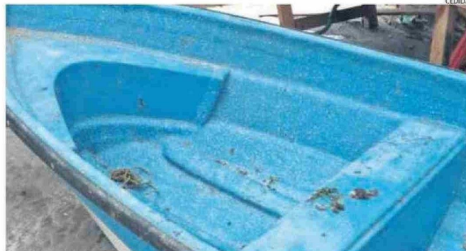
ALGUNAS DE LAS EMBARCACIONES UTILIZADAS TAMBIÉN SE DAÑARON POR EL OLEAJE.