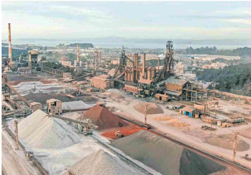
La crisis de Huachipato fue el gatillante que detonó la creación del Plan de Fortalecimiento Industrial del Biobío.