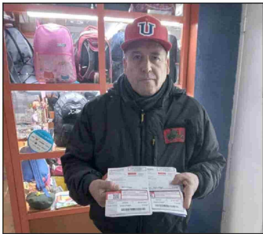
En la imagen se puede apreciar el historial de facturación y pago.