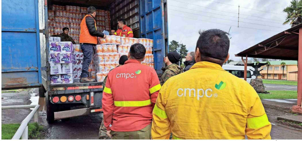
Descarga de productos Softys en el puesto de mando instalado en el regimiento destacamento de Montaña de Los Angeles.