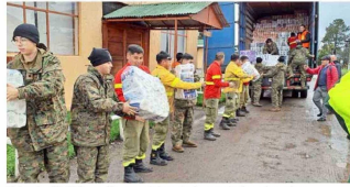
Brigada CMPC y militares del regimiento de Los Angeles descargan productos Softys para entregar a damnificados.