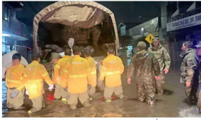
Brigada CMPC apoyando a locatarios de Los Angeles por desborde del estero Quilque.