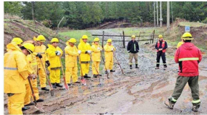
Habilitación de caminos en la comuna de San Rosendo.