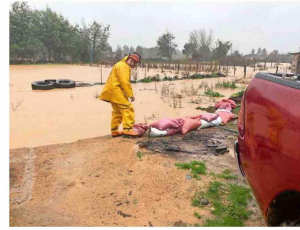
Desagüe y habilitación en la comuna de Santa Juana.