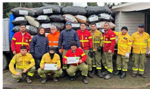
Despachando camión con carbón para secar las casas de las familias afectadas en Concepción.

municipalidad de Negrete, esto no se hubiese enfrentado de la misma forma. Les agradecemos la colaboración y planificación con la municipalidad de Negrete, nuestra comunidad y los vecinos".