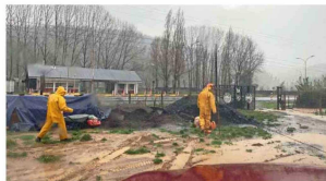
Habilitación Rutas de la Madera, en la comuna de Santa Juana.