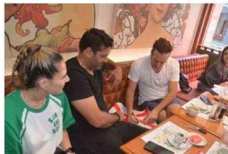
LOS TENISTAS TAMBIÉN CONOCIERON PARTE DE LA CIUDAD Y VISITARON EL LOCAL DE ENTRELAGOS, DONDE COMPARTIERON CON PÚBLICO Y TRABAJADORES.