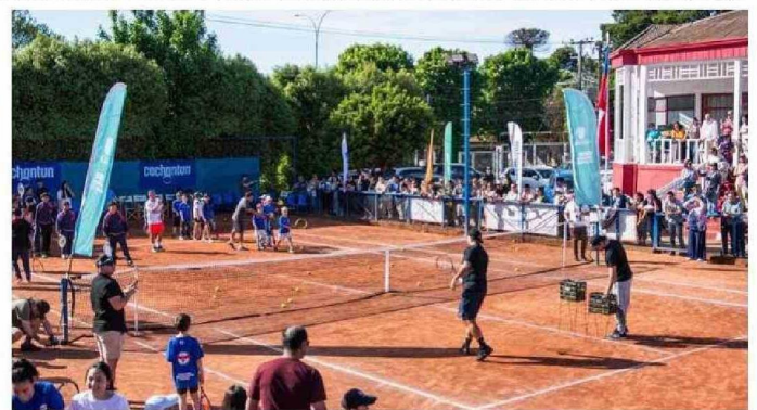
LA CLÍNICA TUVO LA PARTICIPACIÓN DE UN CENTENAR DE JÓVENES DE DISTINTOS CLUBES Y TALLERES DE TENIS.