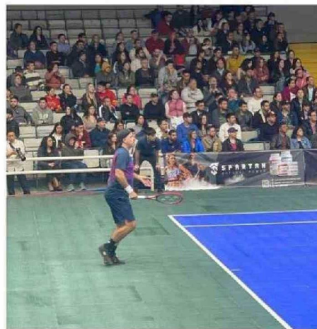
LA GIRA DE LA DUPLA SE DEBE AL ANIVERSARIO N°20 DE LA EPOPEYA QUE AMBOS CONSIGUIERON EN LOS JUEGOS OLÍMPICOS DE ATENAS 2004.