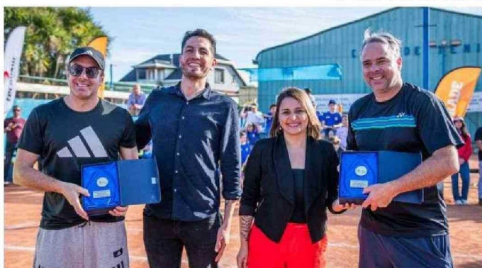
LA ALCALDESA ENTREGÓ UN RECONOCIMIENTO A LOS MEDALLISTAS OLÍMPICOS DURANTE SU VISITA.