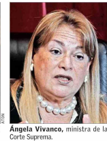
Ángela Vivanco, ministra de la Corte Suprema.