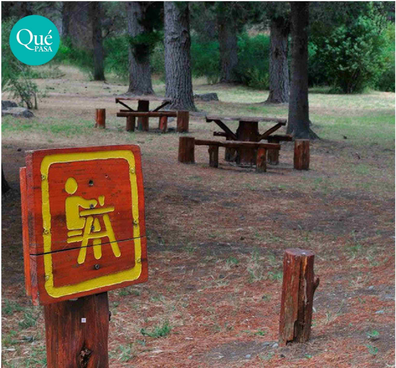
► Durante el verano, debido a las altas temperaturas y la temporada de vacaciones, se producen desplazamientos de personas a zonas donde habita el roedor.