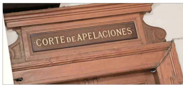
UNÁNIME —La decisión de la Corte de Apelaciones de Santiago se adoptó de manera unánime.

ló los motivos por los cuales procedió de esa forma”. Así, por estas y otras consideraciones, también los jueces, “se rechaza, sin costas, el recurso de protección de acción contra la Contraloría General de la República”. Si bien, en 2018, el entonces contralor Jorge Bermúdez estableció un criterio mediante el cual se aplicaba la confianza legítima cuando un funcionario cumplía dos años en su puesto, es decir, que podía tener la legítima expectativa de que fuera renovado en su cargo al cabo de ese tiempo; pero, en no-