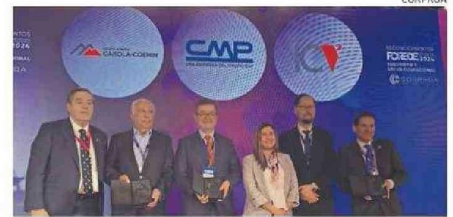
GALARDONADOS EN “SEGURIDAD Y SALUD OCUPACIONAL”.