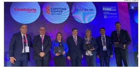
RECONOCIDOS POR “APORTE AL DESARROLLO SOCIAL”.