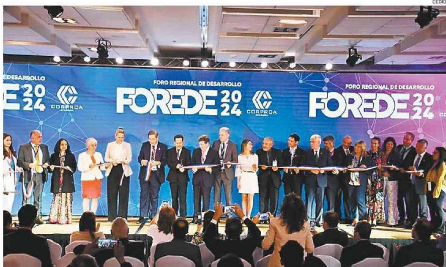
LA CEREMONIA DE INICIO CONTÓ CON LA PRESENCIA DE AUTORIDADES DE NIVEL NACIONAL Y REGIONAL.