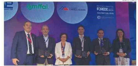
LOS RECONOCIDOS POR “SUSTENTABILIDAD”.