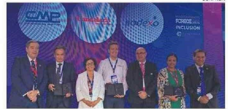
LOS DESTACADOS POR SU TRABAJO EN “INCLUSIÓN”.