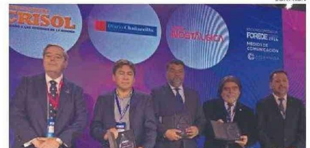
LOS DESTACADOS COMO “MEDIOS DE COMUNICACIÓN”.