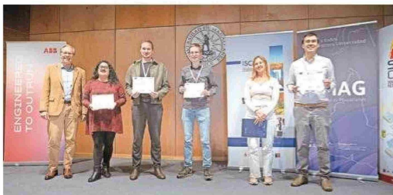
Estudiantes destacados por sus pitch.

entre el 12 y el 17 de enero, en el campus central de la Universidad de Magallanes (Umag).