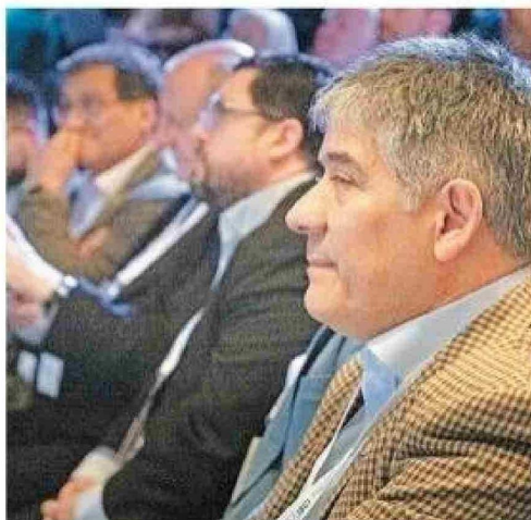
Las actividades del programa se realizaron entre el Cadi-Umag y el campus central. El evento contó con la participación de autoridades locales.

de puede surgir una colaboración. Y con el Instituto de Alemania, el Kit, para posibles visitas y estancias. También estoy pensando en ver la