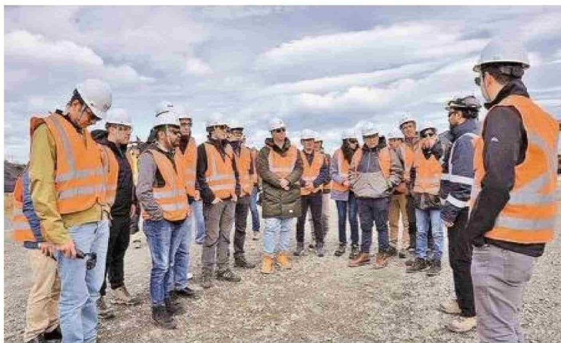
Los participantes recibieron una charla antes de ingresar a la planta.

En definitiva, se trata de una tecnología que permite solucionar una de las principales limitaciones de las energías renovables: su intermitencia. Al aprovechar los momentos de alta producción para transformar el excedente eléctrico en hidrógeno u otras componentes que pueden ser almacenados, se estabiliza y absorbe la fluctuación de la producción renovable.