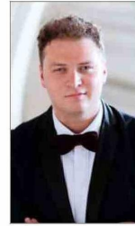
El barítono Ismael Correa .

mara, "porque es muy íntimo y cuenta con muchos detalles".