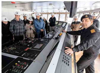
Delegación conoce detalles de la sala de control del buque.