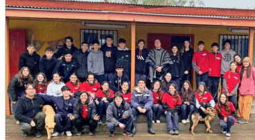
En Guayacán, Cabilido, Valparaíso, el grupo del Colegio San Miguel Arcángel.