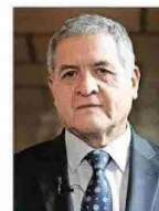
Carroza llegó al máximo tribunal en 2020.

Actualmente es el coordinador de la Corte Suprema para estas causas. Es un magistrado de carrera judicial, asumió como supremo en 2020, y hoy integra la Tercera Sala (la constitucional).