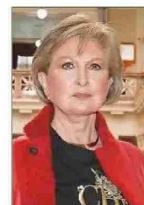
Letelier integra la Sala Penal de la Suprema.

Llegó al máximo tribunal en 2021 —propuesta por el expresidente Sebastián Piñera y con la ratificación unánime del Senado—, tras ser ministra de la Corte de Apelaciones de San Miguel. Uno de los casos conocidos por la opinión pública que pasó por sus manos fue el de la filtración de los facsimiles de la Prueba de Aptitud Académica en 1998. En 2004 fue ministro en visita por el bombarzo que destruyó el frontis del BancoEstado en Gran Avenida.