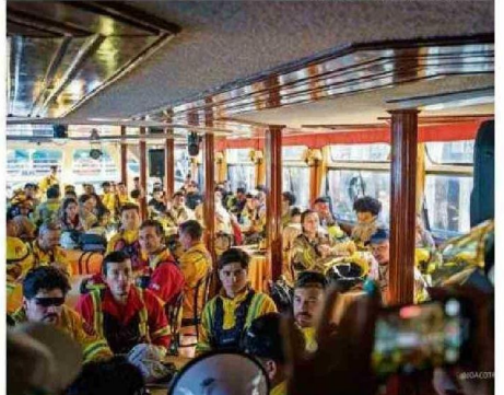
CUERPO DE BOMBEROS DE VALDIVIA