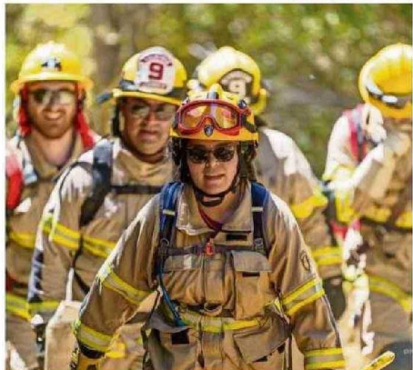
CUERPO DE BOMBEROS DE VALDIVIA