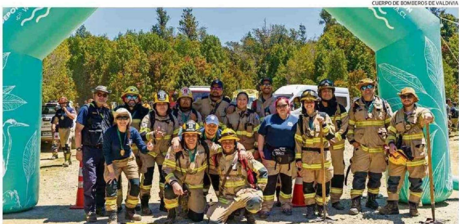
EL EVENTO SE REALIZÓ EL SÁBADO 14 DE DICIEMBRE, EN DEPENDENCIAS DEL PARQUE ONCOL.