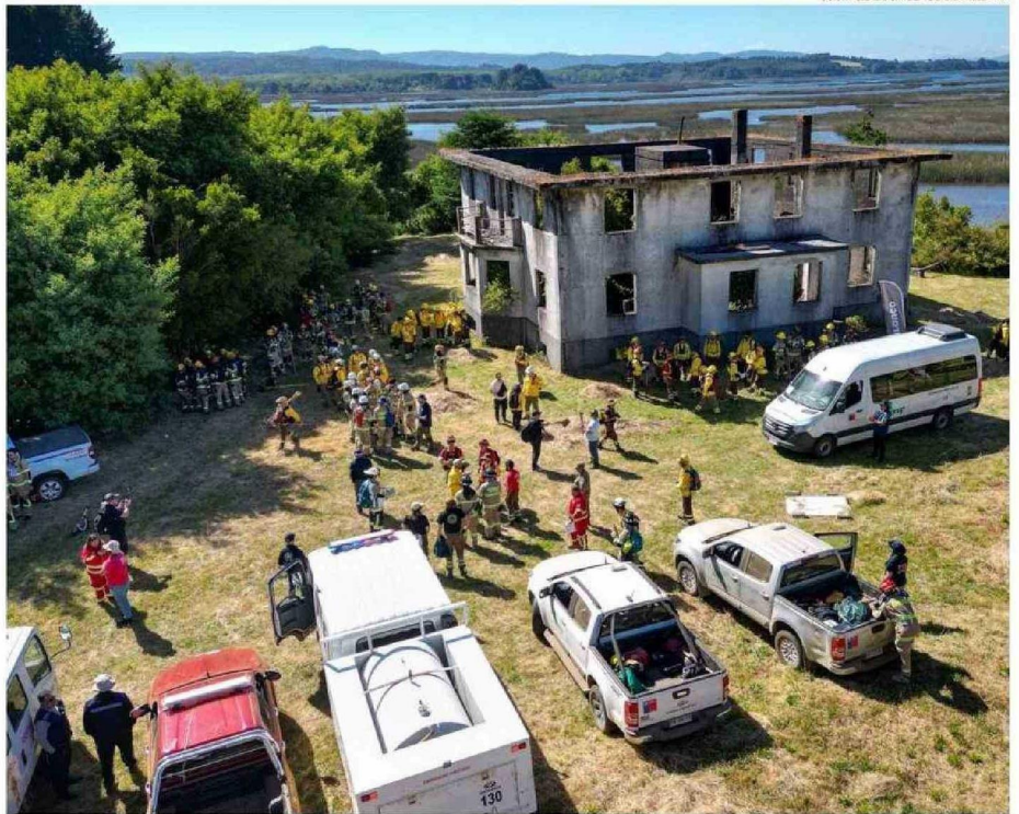
LA ACTIVIDAD CONVOCÓ A VOLUNTARIOS DE LOS RÍOS, ADEMÁS DE BRIGADISTAS DE CONAF Y REPRESENTANTES MILITARES Y DE ARAUCO, ENTRE OTROS.

En relación a los resultados: el primer lugar fue para la Brigada Lingue 4 de Conaf; seguida por la Cuarta Compañía de Bomberos Forestales de Follico (Los Lagos) y la Brigada Forestal del Ejército de Chile, respectivamente.