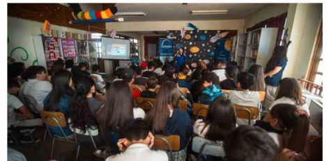
En la actividad participaron estudiantes de 4º, 5º y 6º básico de los colegios Polivalente Elisa Valdés y Quitalmahue de Puente Alto.

Por segundo año consecutivo, estudiantes de 4º, 5º y 6º básico del Colegio Polivalente Elisa Valdés y el Colegio Quitalmahue, ambos ubicados en el sector Bajos de Mena de Puente Alto, participan en el proyecto educativo "Desafío Curiosity". Esta iniciativa, que se mantendrá activa hasta 2025, beneficia