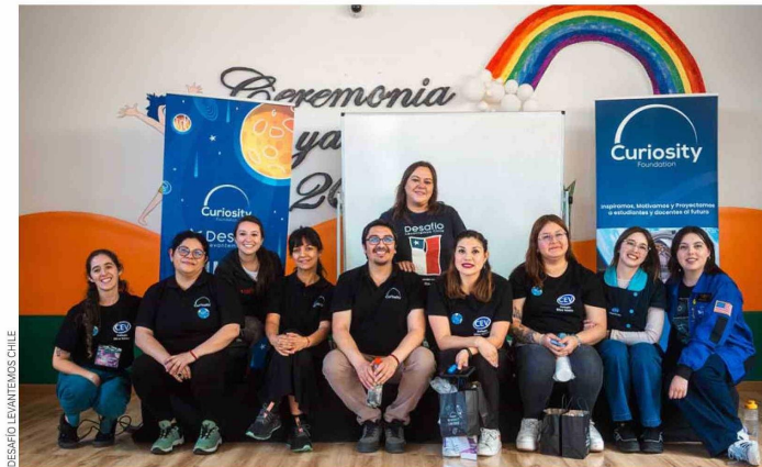
DESAFÍO LEVANTEMOS CHILE

La iniciativa nace por la falta de un desarrollo sistemático y progresivo de las habilidades socioemocionales que, tras la pandemia se vieron altamente potenciadas, junto a los problemas de convivencia y