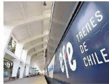
EFE acudió al Segundo Tribunal Ambiental, presentando una reclamación formal en contra de las resoluciones de la SMA, que fue admitida a trámite el 16 de mayo de 2022.