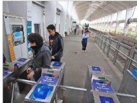
La empresa fue sancionada con 1.071 UTA por el fraccionamiento del proyecto "Rancagua Express" e cumplir con los requisitos ambientales necesarios.

tud de EFE de extinguir el procedimiento administrativo sancionatorio por el supuesto decaimiento del proceso debido al tiempo que la SMA tardó en emitir la resolución. La corte señaló que, aunque existió una demora en la tramitación del caso, esta fue justificada por la complejidad de la infracción y por las acciones realizadas por la Administración y otros actores durante el período en cuestión. Por lo tanto, no se configuró el elemento de la "inutilidad" que EFE alegaba. El Tribunal, compuesto por los ministros Cristián Delpiano Lira y Cristián López Montecinos, reafirmó en su sentencia que las autoridades ambientales deben garantizar que los proyectos no solo cumplan con los requisitos técnicos, sino que también respeten plenamente las normativas ambientales para