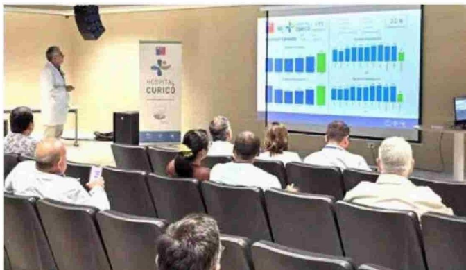
Asamblea de todos los médicos, de la provincia de Curicó.