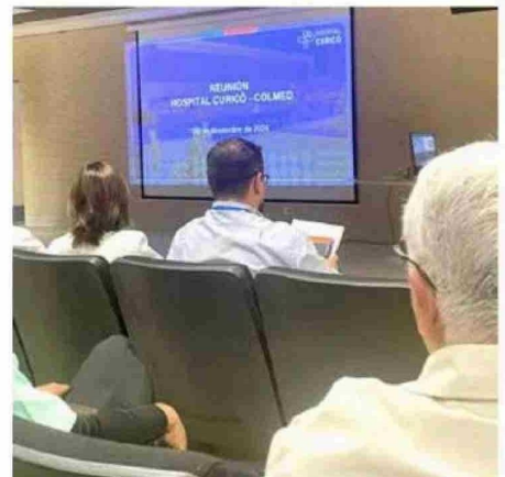
El encuentro se llevó a cabo en el Hospital de Curicó.