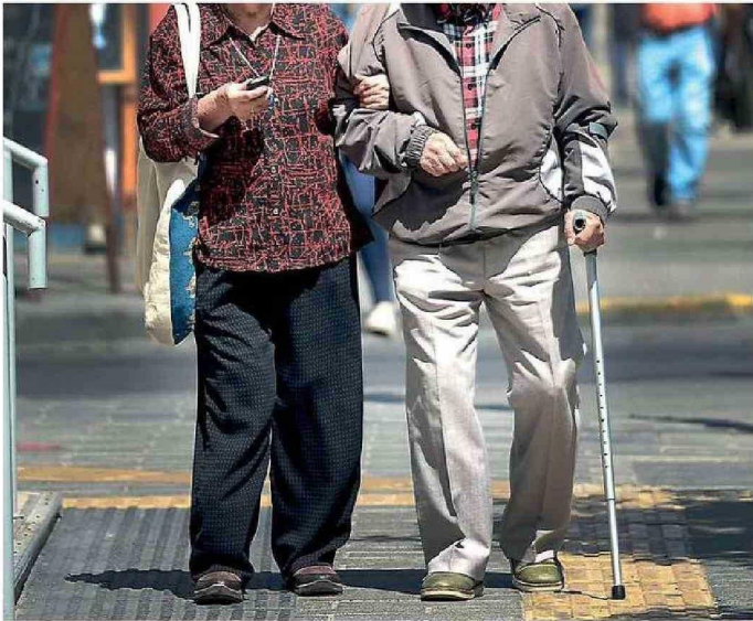
EL ADULTO MAYOR VIVE VIOLENCIA EN SUS DISTINTAS FORMAS.

tiene un factor común: el adulto mayor quiere sentirse visibilizado y considerado en el sistema, porque se siente excluido de la sociedad.