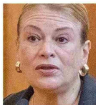
Ángela Vivanco , la ministra de la Suprema fue suspendida de su cargo y se abrió un cuaderno de remoción.