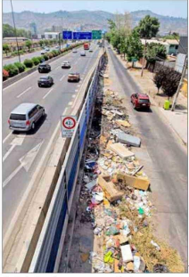
A inicio de semana, la basura ocupaba una vía de la caletera.