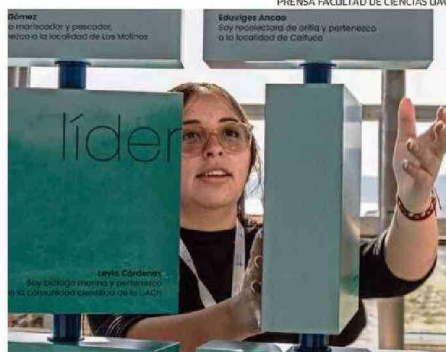
ESTUDIANTES UACH FUERON CAPACITADOS COMO GUÍAS.