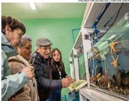
CON LOS CESFAM SE HA PROPICIADO VISITAS DE PERSONAS MAYORES.