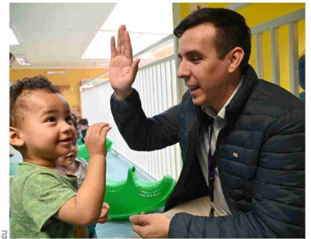
Uno de los objetivos del SLEP, es mejorar la convivencia escolar desde la primera infancia.

“La convivencia escolar no solo debe ser aplicado en lo disciplinario, sino también, en lo formativo en los trabajos colaborativos con las redes de apoyo. Una sanción disciplinaria en los casos de bullying, por ejemplo, no va a cambiar la conducta del estudiante, que entre comillas, lo indico como agresor. Porque este estudiante, merece y requiere un tratamiento formativo. Eso es lo que hemos estado haciendo bastante con los respectivos encargados de convivencia escolar”, concluyó el jurista.