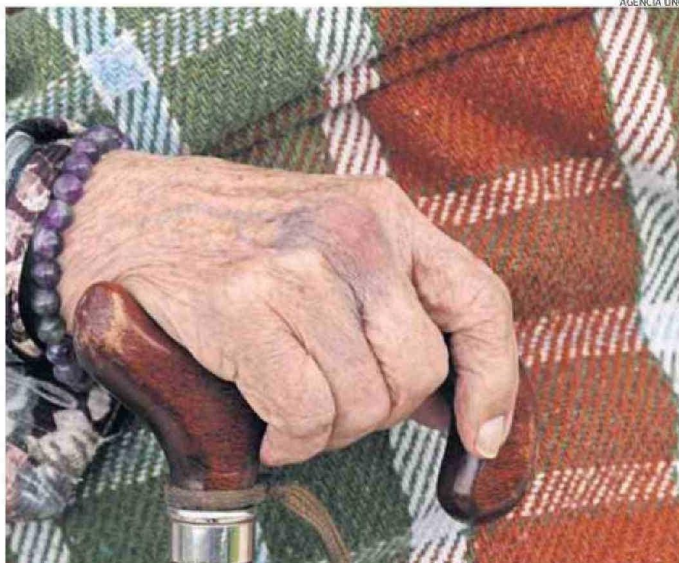
UN FACTOR CRÍTICO ES LA SALUD DENTAL Y VISUAL DE ADULTOS MAYORES: MUCHOS NO PUEDEN LEER ETIQUETAS.

El 5,6% de los encuestados señaló haber pasado un día