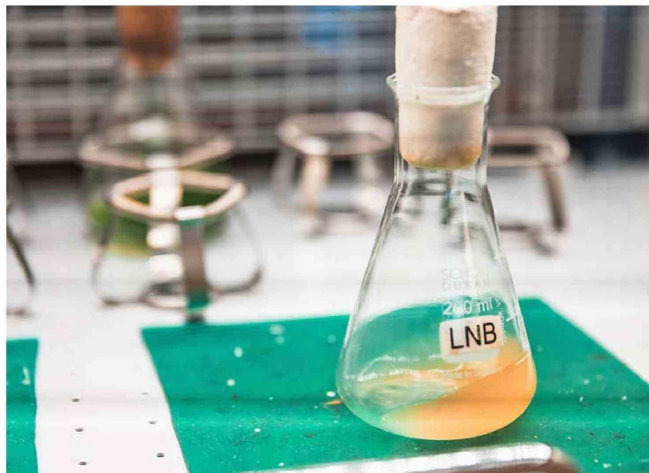
Recipiente de laboratorio con agua residual y E. coli.