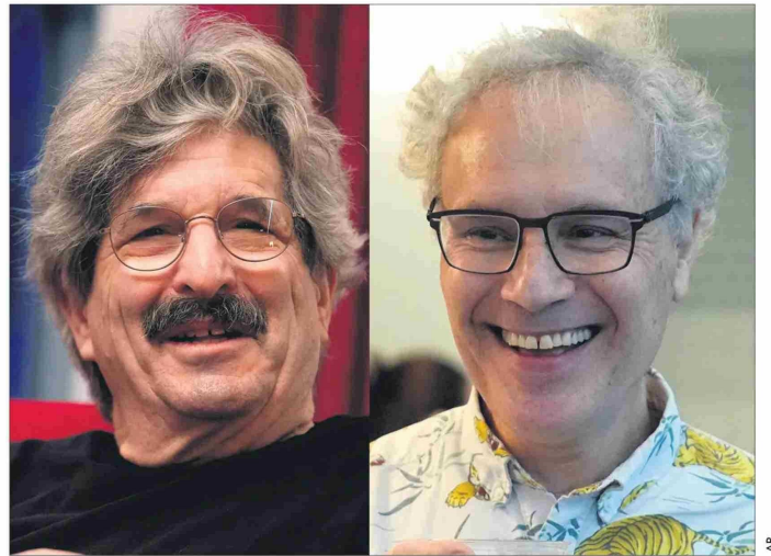
Los estadounidenses Victor Ambros y Gary Ruvkun descubrieron los microARN, pequeñas moléculas que controlan la expresión genética, cruciales para el desarrollo, la especificidad y el funcionamiento celular.

son fundamentales en una amplia variedad de enfermedades. "Lo interesante es que complementan la información proporcionada por los genes de predisposición a enfermedades, ya que actúan como elementos reguladores", destaca y de un ejemplo: "Imagina dos personas con una predisposición genética similar; la diferencia puede estar en sus perfiles de microARN. Esta diferencia puede tener un impacto significativo en el desarrollo de una enfermedad. Una persona podría desarrollar una enfermedad autoinmune porque carece de ciertos microARN, mientras que otra, con