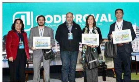
INVITADOS ANALIZARON LOS DESTINOS DE INVERSIÓN ESPAÑOLA EN CHILE.

Ley de Responsabilidad Extendida del Productor (REP). Así, destacó que hoy existen mecanismos que permiten reformular algo que era un desperdicio, y hacerlo parte de una materia prima dentro de un proceso productivo.