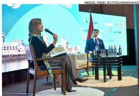
LA ECONOMÍA CIRCULAR FUE UNA DE LAS MATERIAS ABORDADAS.

Respecto de la materia revisada, destacó que hace diez años trabajan en la línea de la sostenibilidad. “Recuerdo cómo en esos años ya estábamos apoyando al Ministerio del Me-