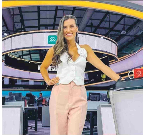
En su trabajo, en Megatiempo.

Vive a ocho kilómetros, pero "hago un recorrido más largo. Es súper práctico". También lo hace a la inversa.