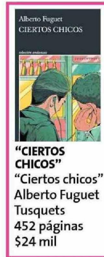
"CIERTOS CHICOS" Alberto Fuguet Tusquets 452 páginas $24 mil

—Ahora esta novela pasa durante el régimen, época en que igual había fiestas,