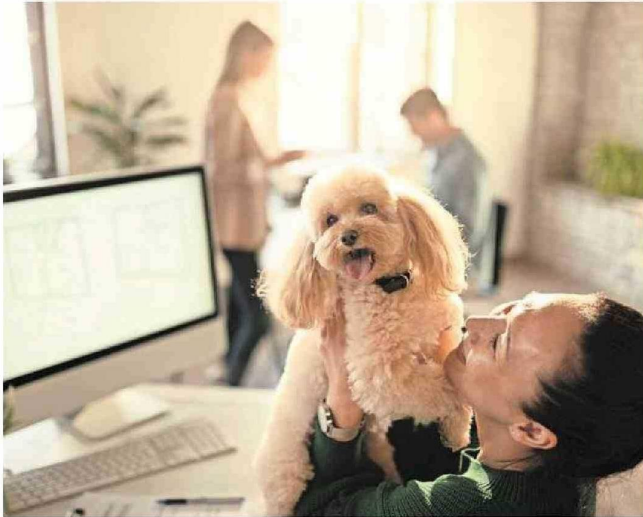
REPORTARON UNA REDUCCIÓN SIGNIFICATIVA DE ESTRÉS.