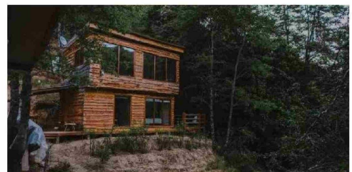
La oferta para desconectarse del ajetreo de la ciudad incluye alojamiento en cómodas cabañas.

El verano 2025 en la Cordillera de Nahuelbuta tendrá diversas actividades para disfrutar de este periodo estival, entre los que destacan el Festival Astronómico y el Festival Campesino, ambos a realizarse en enero, así como