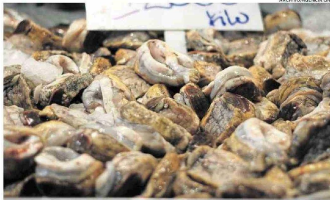
EL LOCO ES EL PREFERIDO DE LOS ATACAMEÑOS EN CUANTO A MARISCOS.

Además, el estudio devela que el 90% del consumo de productos marinos se realiza en el hogar y que el pescado más consumido a nivel nacional es la reineta (41,5%) y la merluza (27%), mientras que