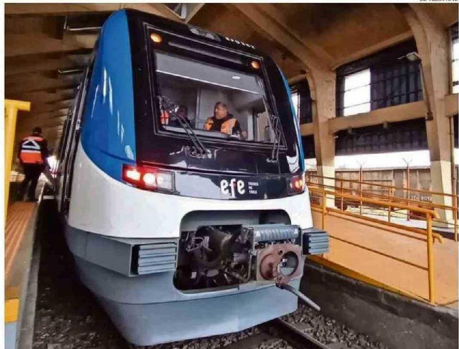
LOS SERVICIOS FERROVIARIOS TEMUCO-VICTORIA Y TEMUCO-PITRUFQUÉN SON OPERADOS CON TRES TRENES.

“Las cifras mensuales nos hace ver el futuro con mucha esperanza, así como también nos motivan a continuar trabajando para que los trenes brinden cada día un mejor servicio. Años atrás, operábamos solamente con el servicio que conocíamos como Tren Victoria-Temuco. Tras las inversiones realizadas para el mejoramiento de las vías y la incorporación del servicio Temuco-Pi-