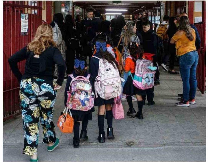
REPRESENTANTE DEL COLEGIO DE PROFESORES VE OPORTUNIDADES PARA LA INNOVACIÓN PEDAGÓGICA CON EL PERFIL DE DIRECTORES DE ESCUELA QUE HAY EN LA REGIÓN.

Aclara, además, que “esa doble función no solo ocurre en lo rural, sino en establecimientos educativos urbanos, donde el foco de atención es cómo potenciar y mejorar los aprendizajes de los estudiantes con buenas prácticas que tengan un im-